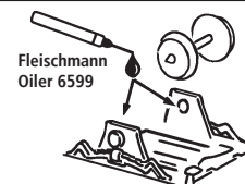
Fleischmann Oiler 6599

Les pièces de finition illustrées sont à monter par le modéliste. Le jeu de pièces peut comprendre d'autres pièces (non illustrées) qui sont destinées à autres versions du modèle et qui sont superflus à la variante présente.